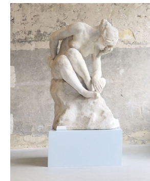
Sculpture de Jules Desbois